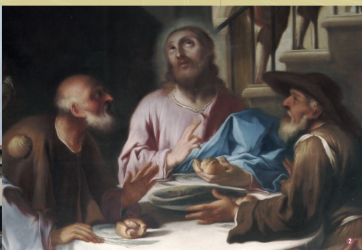
1 Chiesa di Santa Maria Assunta. 2 Cena di Emmaus (Antonio Paglia, 1733). 3 La Madonna del Latte. 4 Assunzione di Maria.

unica con volta a botte, sui lati si aprono quattro cappelle mentre il profondo presbitero termina con un'abside poligonale. Il marmoreo altare maggiore è sovrastato dalla pala raffigurante l'Assunzione di Maria di autore ignoto. Molto interessanti sono le cappelle con i relativi altari: sul lato est l'altare del Sacro Cuore con soasa lignea barocca e l'altare in marmo della Beata Vergine del Rosario; sul fronte ovest l'altare della Confraternita del Santissimo Sacramento, con la pala della cena di Emmaus di Antonio Paglia (1733) e l'altare della Beata Vergine del Carmine nella quale venne collocato lo strappo di un affresco, di inizi XVI secolo, proveniente dalla chiesetta di San Michele sul monte. L'affresco raffigura la "Madonna del Latte" entro una cornice lignea dorata ricca di fiori e putti (proveniente probabilmente dalla chiesa demolita di San Vittore) attribuita al celebre intagliatore Gaspare Bianchi di Lumezzane, uno dei più validi scultori bresciani del sec. XVII. Il dipinto del Paglia raffigura i discepoli di Emmaus con i vestiti caratteristici dei pellegrini: il piccolo mantello o sanrocchino, il cappello a tesa larga, il bastone o bordone e la conchiglia o capasanta simbolo del pellegrinaggio a Santiago de Compostela.