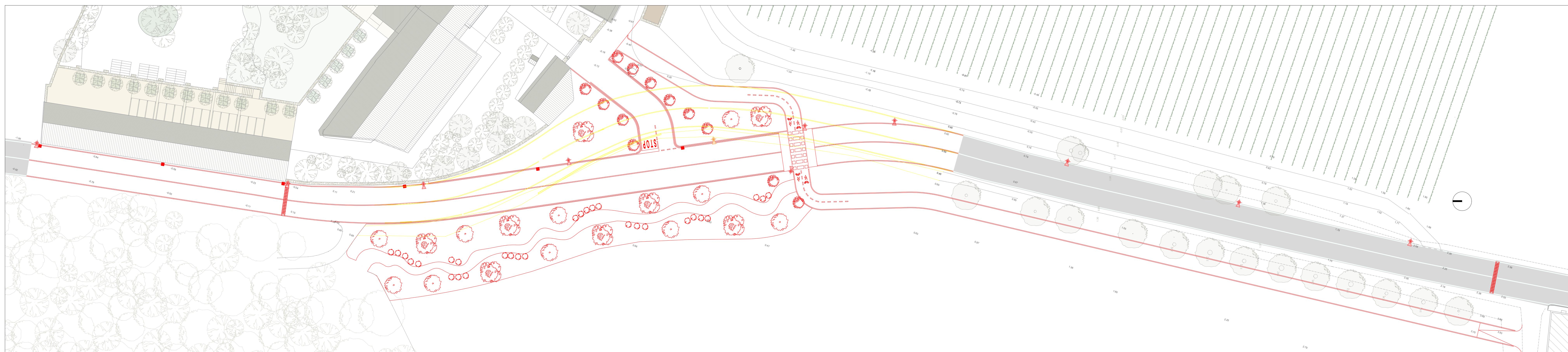
PLANIMETRIA AREE EXTRA COMPARTO - STATO DI RAFFRONTO - 1: 250