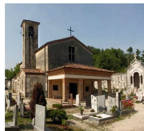
CHIESA DI S. EUFEMIA