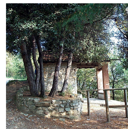
SANTELLA DELLE GAMBE