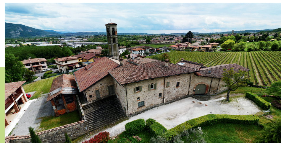
S. MARIA IN ZENIGHE